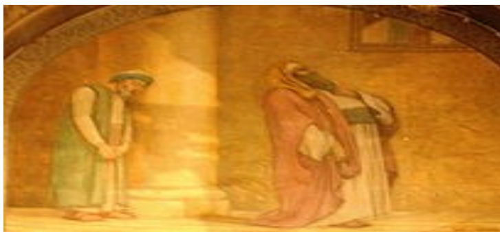
Fresko in der Saint-Joseph-Kirche in Marseille